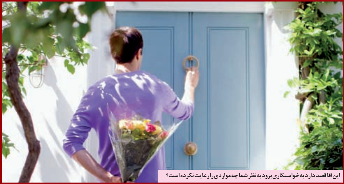
این آقا قصد دارد به خواستگاری برود به نظر شما چه موار دی را رعایت نکرده است؟

سلام مادر دلسوز و کوشا. نصیحت های مکرر شما در او احساس بی کفایتی و ضعف بودن را ایجاد می کند و باعث شکست غرورش می شود. شما باید به او به عنوان پسر بزرگ تر نگاه کنید او در امور مهم مشورت بگیرد و کمک نخواهد و در لایه این مشورت هایه استعدادهایش اشاره کنید (در حضور جمع باشد بهتر است) تا میل به پیشرفت در او زود شود.